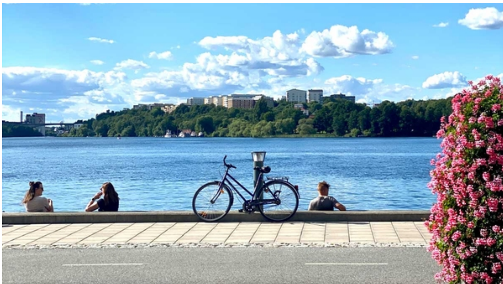
En stund vid vattnet i Stockholm